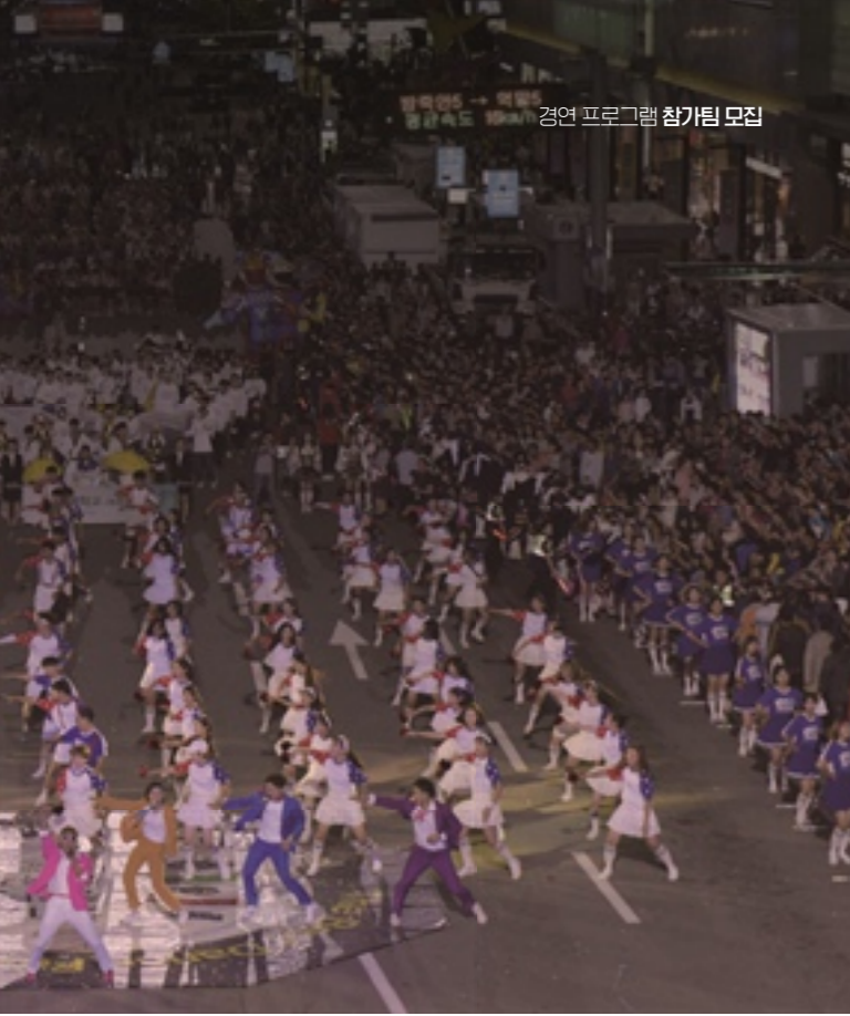
경연 프로그램 참가팀 모집