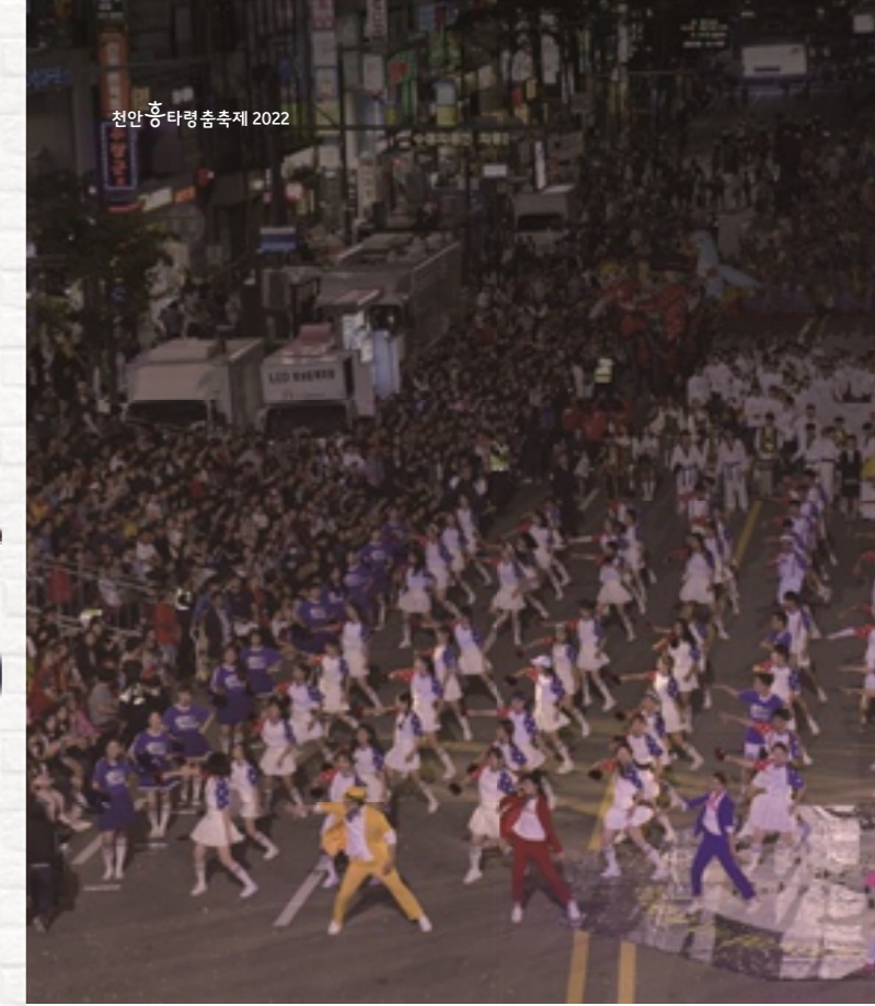
천안 흥타령춤축제 2022